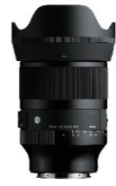
35mm F1.2 DG II 接環: L-Mount, Sony E-mount