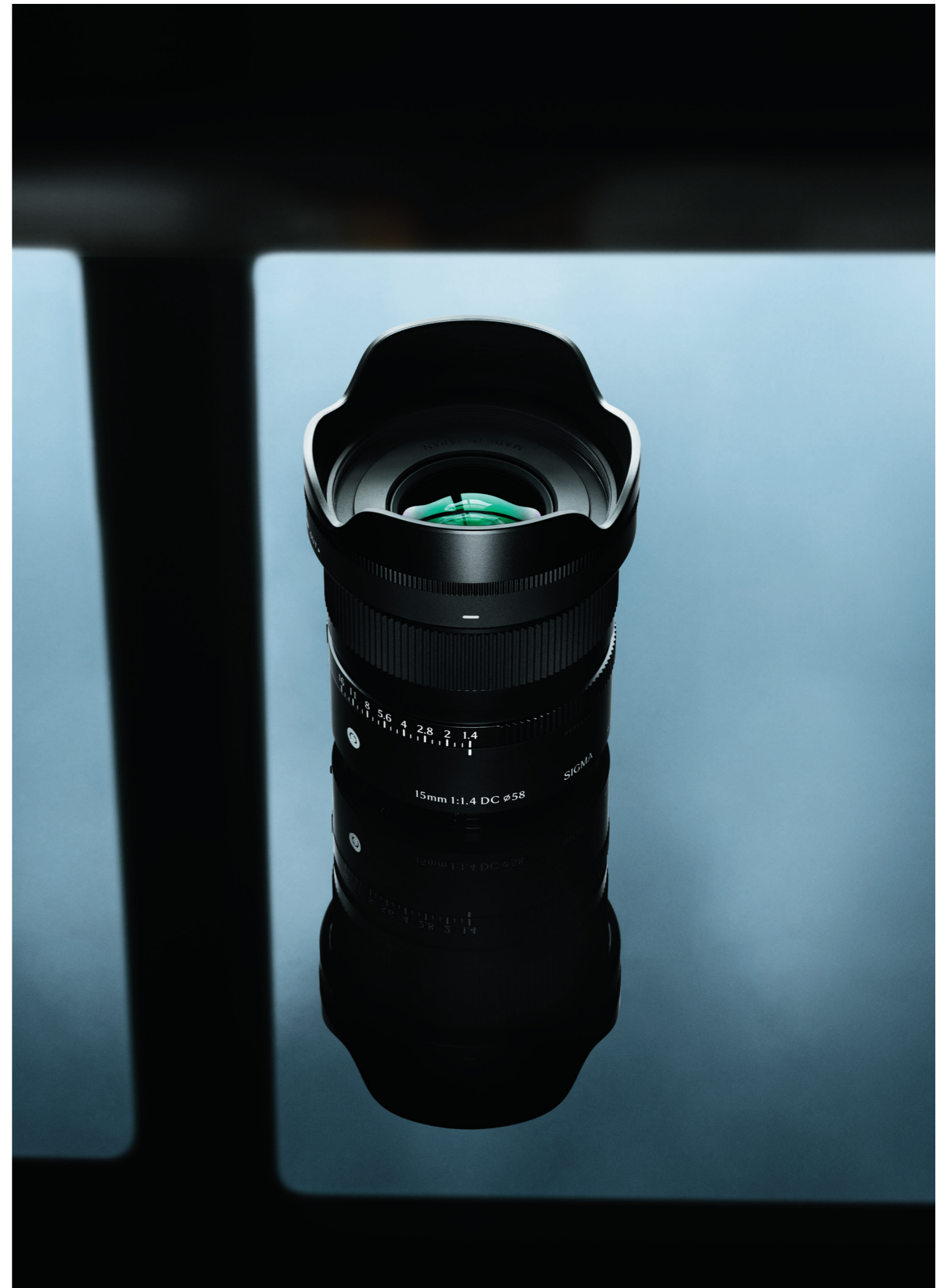
15mm F1.4 DC | Contemporary