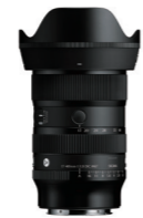
17-40mm F1.8 DC 接環: L-Mount, Sony E-mount, FUJIFILM X Mount, Canon RF Mount