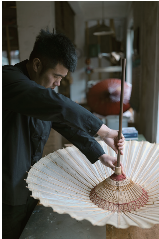
35 mm F1.4 DG II | Art F1.6, 1/320s, ISO250 Du Lichao