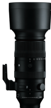
60-600mm F4.5-6.3 DG DN OS 接環: L-Mount, Sony E-mount