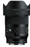
35mm F1.4 DG II 接環: L-Mount, Sony E-mount