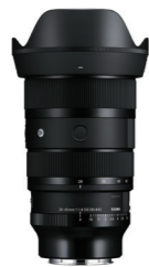
28-45mm F1.8 DG DN 接環: L-Mount, Sony E-mount