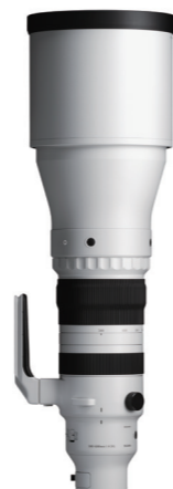
300-600mm F4 DG OS 接環: L-Mount, Sony E-mount