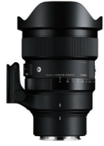
15mm F1.4 DG DN DIAGONAL FISHEYE 接環: L-Mount, Sony E-mount