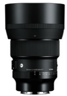
85mm F1.4 DG DN 接環: L-Mount, Sony E-mount