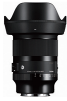
20mm F1.4 DG DN 接環: L-Mount, Sony E-mount