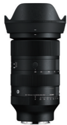
28-105mm F2.8 DG DN 接環: L-Mount, Sony E-mount