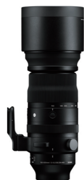
150-600mm F5-6.3 DG DN OS 接環: L-Mount, Sony E-mount