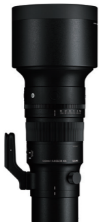
500mm F5.6 DG DN OS 接環: L-Mount, Sony E-mount