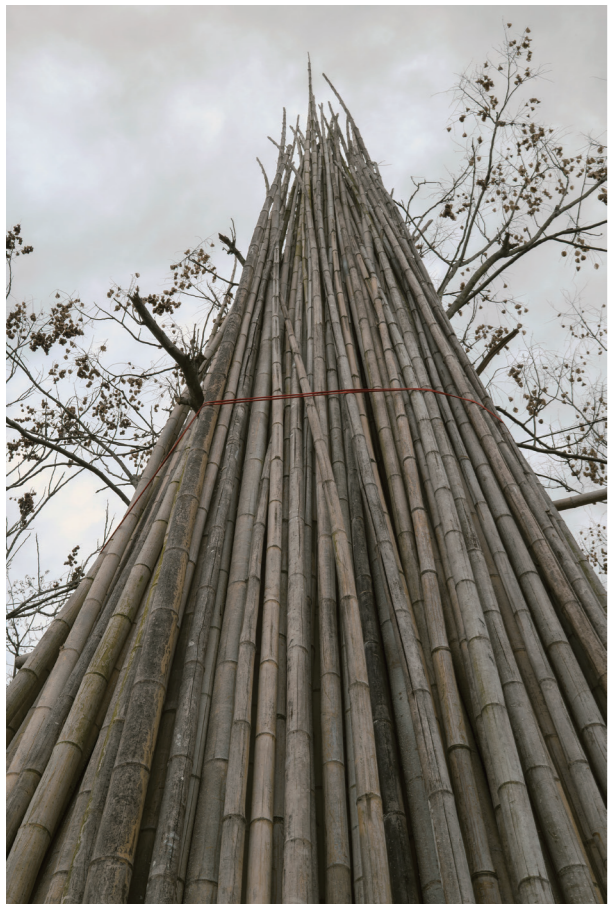
35mm F1.4 DG II | Art F9.0, 1/160s, ISO200 Du Lichao