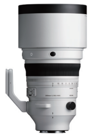
200mm F2 DG OS 接環: L-Mount, Sony E-mount