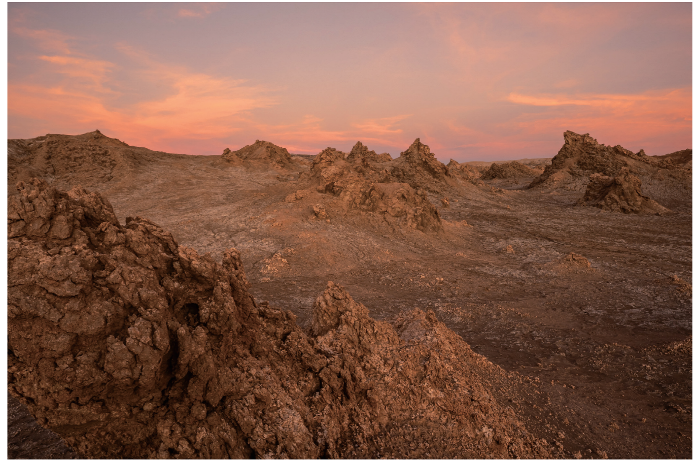
15 mm F1.4 DC | Contemporary F1.6, 0.5s, ISO100 Pato Oses