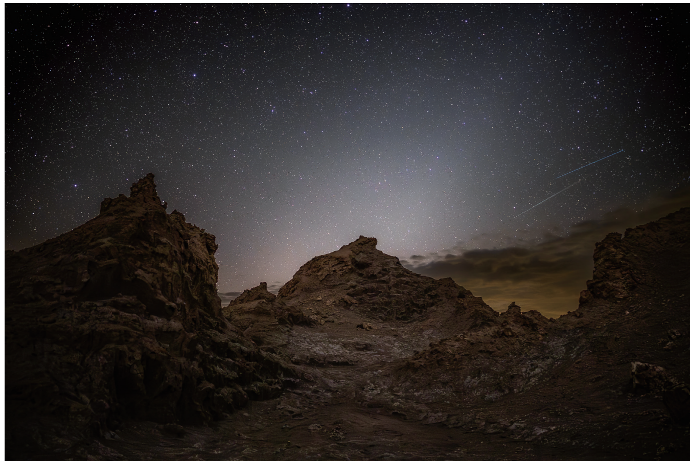
15 mm F1.4 DC | Contemporary F1.6, 15s, ISO2500 Pato Oses