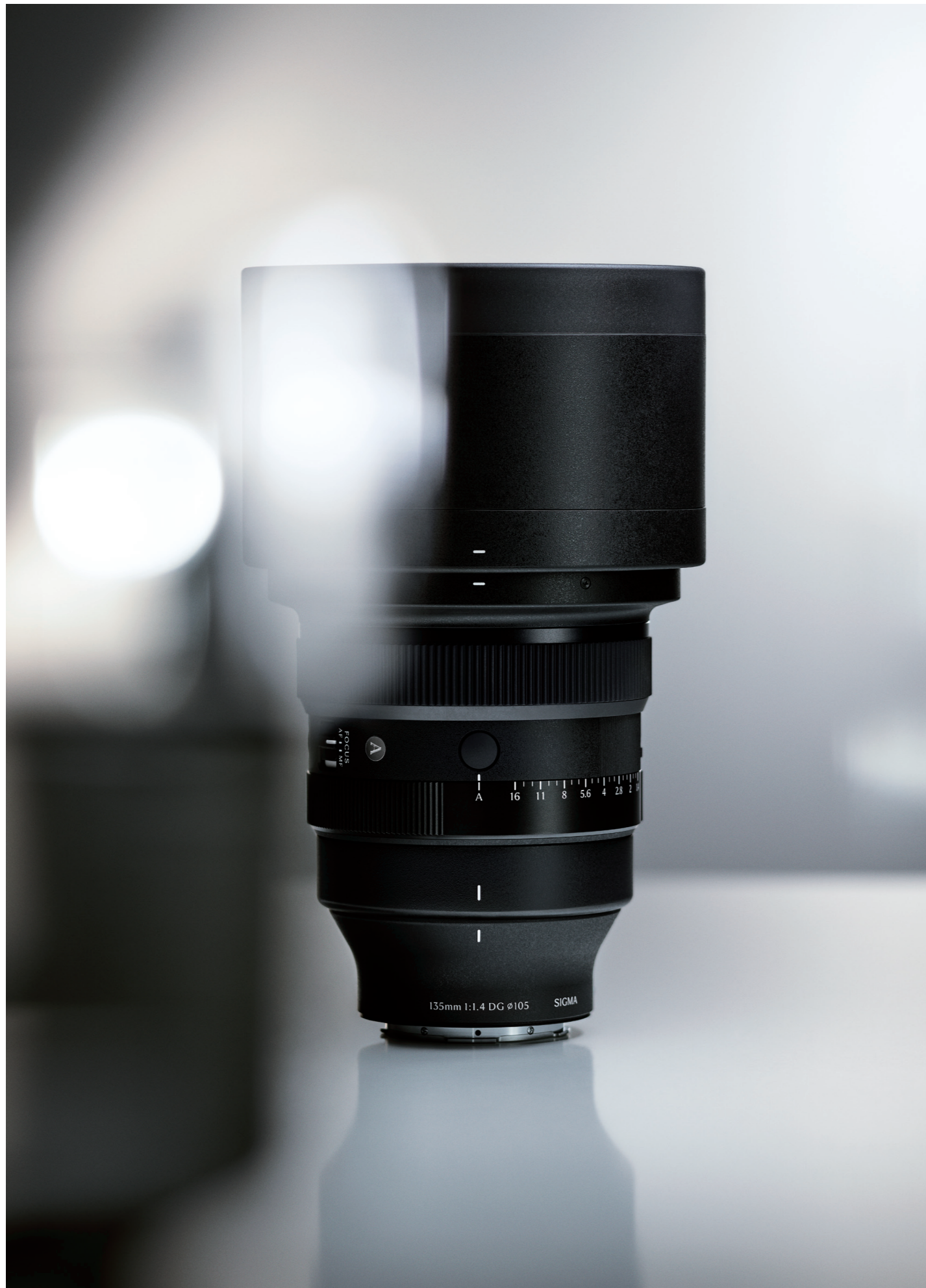
135mm F1.4 DG | Art