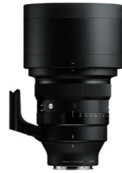
135mm F1.4 DG 接環: L-Mount, Sony E-mount