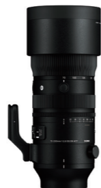
70-200mm F2.8 DG DN OS 接環: L-Mount, Sony E-mount