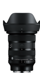
24-70mm F2.8 DG DN II 接環: L-Mount, Sony E-mount