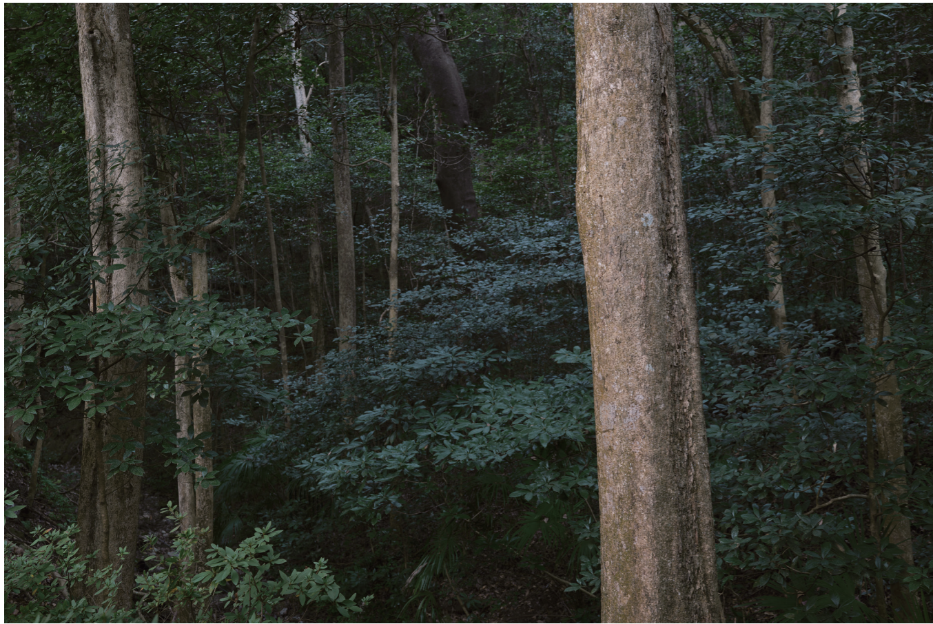
35mm F1.4 DG II | Art F4.5, 1/100s, ISO200 Du Lichao