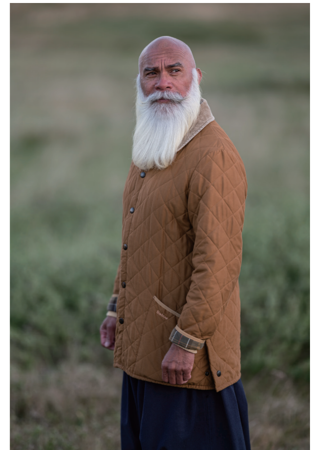
135 mm F1.4 DG | Art F1.4, 1/100s, ISO50 Marc Haers